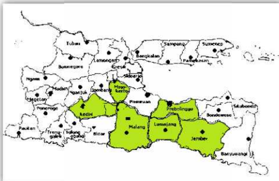
Gambar 2. Pusat Agribisnis Jawa Timur

Sebagaimana telah disinggung dalam pembahasan sebelumnya bahwa visi jangka panjang Jawa Timur adalah menjadi pusat agribisnis terkemuka dapat dipandang sebagai upaya untuk mengakomodir potensi sektor pertanian dengan sektor industri yang relatif berimbang. Sementara potensi Jawa Timur dalam agribisnis sebenarnya relatif besar. Setidaknya terdapat sembilan perusahaan agribisnis pemerintah yang tersebar dalam enam daerah Kota/Kabupaten di Jawa Timur.